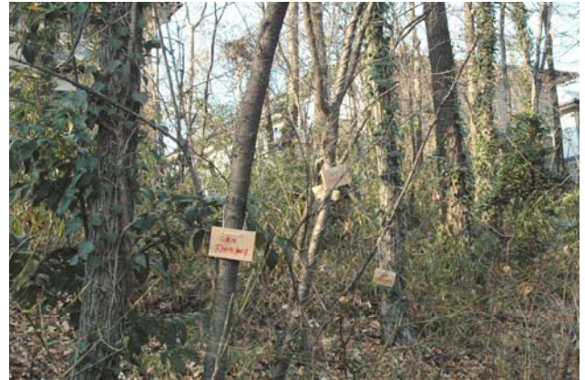
(木札を着けたサクラの木)

木札に「これは大切な木です。」と書いて、木に着けました。手持ちの木札では足りずに、