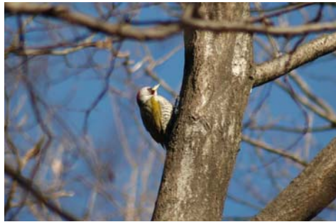
アオゲラ<キツツキ科>