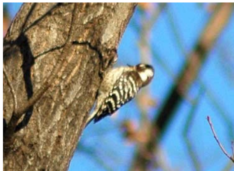
コゲラ<キツツキ科>