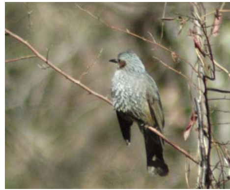
ヒヨドリ(ヒヨドリ科)