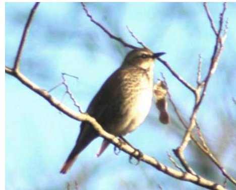
シロハラ(ヒタキ科)