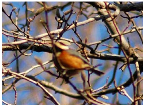
アカハラ(ヒタキ科)?