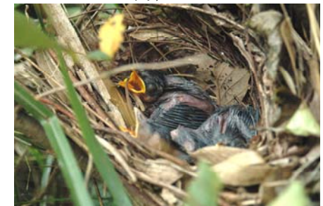
ガビチョウのひな

この他に、アオジ、ウグイス、エナガ、オナガ、カルガモ、カワラヒワ、キジ、キジバト、コジュケイ、ジョウビタキ、スズメ、ツバメ、ドバト、ハクセキレイ、ハシボソガラス、ヒヨドリ、ホオジロ、ムクドリ、メジロ、モズ、等が、2008年の観察で確認されています。