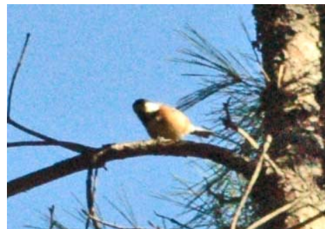
ヤマガラ(シジュウカラ科)