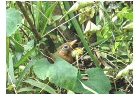
ガビチョウ(チメドリ科)