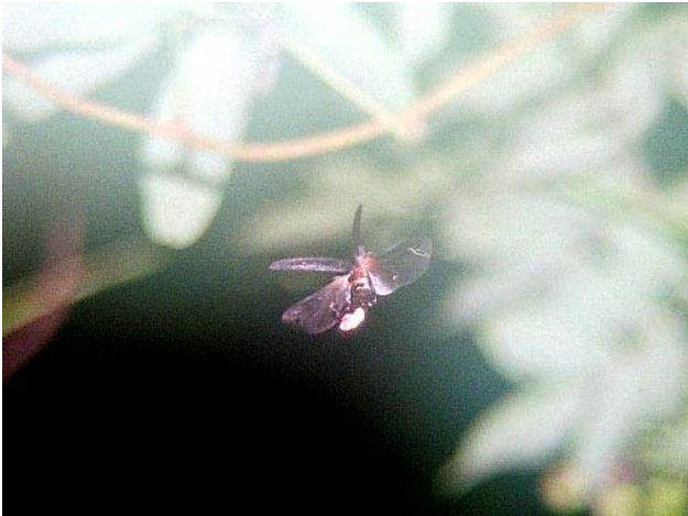
片所谷戸のゲンジボタル(05年6月25日撮影)