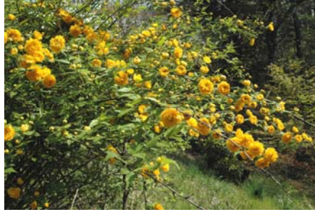
ヤエヤマブキ(これは3号緑地へ植えたものですね。)