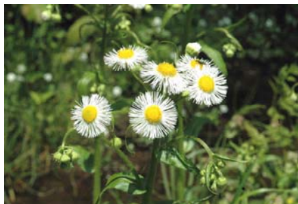
ハルジオン(谷戸一面に咲きます。)