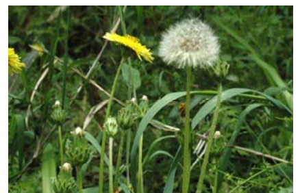
カントウタンポポ(荅、花、種)