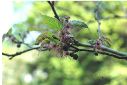
ヒメコウゾの花と実