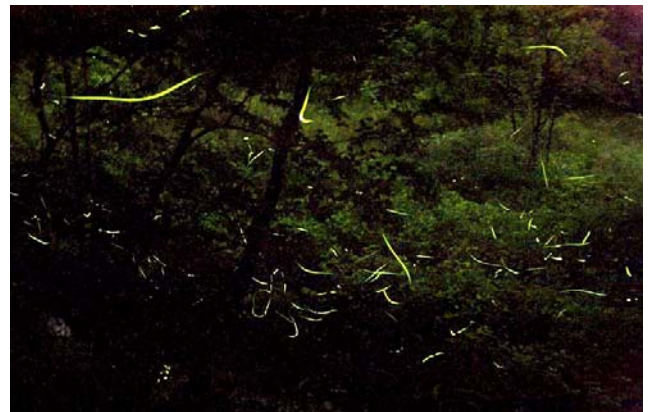
片所谷戸のゲンジホタルの光

この日以外でも、お知らせいただければ、案内できますので、事務局或は<090-3009-2941>へお電話を下さい。