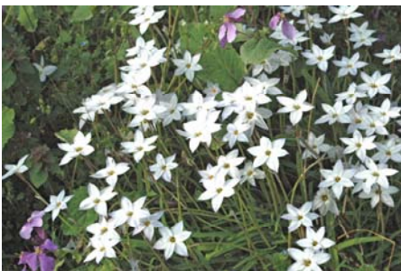
ハナニラ(アマナではないとのご指摘がありました。)