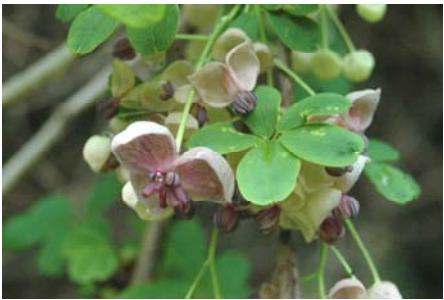
アケビ、ミツバアケビもあります。