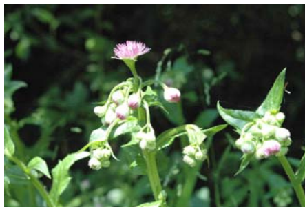
これもハルジオン(ヒメジオンと見分けるのがなかなか難しいです。)