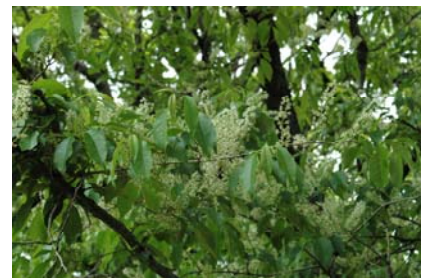
イヌザクラ(よく花が開いています。) <花の名前には自信がありません。間違いがありましたら、ご指摘下さい。>