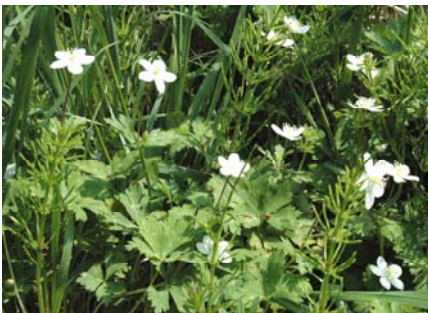
ニリンソウ (川筋によく咲いています。イチリンソウは誰かに抜かれてしまいました。)