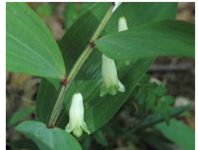
これはユリ科のアマドコロでしょうか？