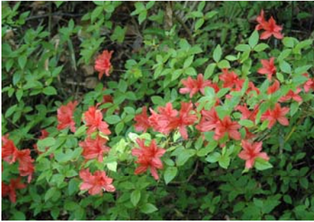
ヤマツツジ(ツツジにも何種類もあります)