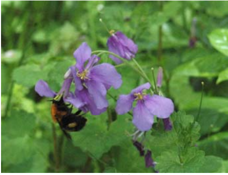
シヨカツサイとクマバチ(或はマルハナバチ?)とのご指摘がありました。