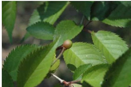
ホシザクラも、少しですが実をつけます。