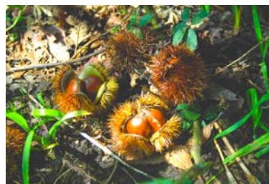
落下したクリの実