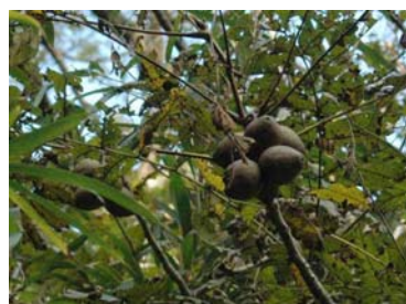
オニグルミ (名前はちがっているものがある かも知れません)