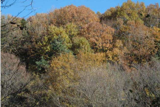
東の山 色とりどりの個性豊かな紅葉