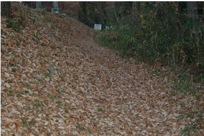
赤道（あかみち）への足の踏んだもない落葉