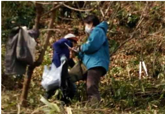
片所北緑地の下草刈です。女性会員二人が頑張っています。(2.22日)