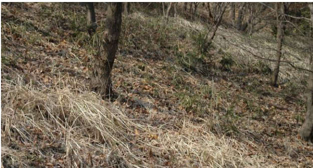
3号緑地も良く下草が刈られています。