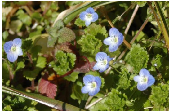
オオイヌノフグリでしょうか、太陽に向かって花びらを一杯に広げていました。(3.2)