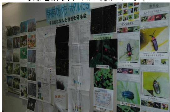
小山市民センター祭に、ホタルとサクラの写真の展示をしました。大勢の人が見に訪れ、話をしました。(3.1)