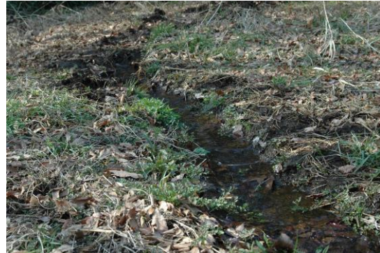
沼地の川辺には、セリが良く生え、(2.22)