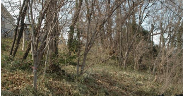
片所北緑地下草(主に竹)刈跡(2.22)