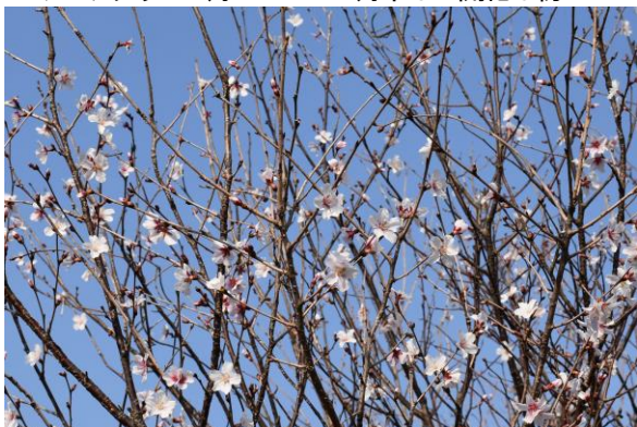
ヤブザクラ 3月23日、満開に近い。