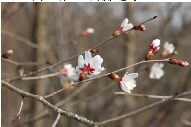
タマノホシザクラも3月23日には開花、いつもの年より 1週間位早く咲きました。