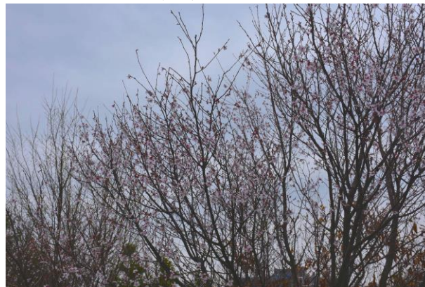
4月3日のヤブザクラとタマノホシザクラ、満開です。