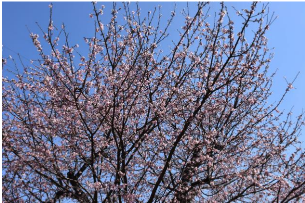
オオカンザクラ 3月15日、何時もの年のように早い

今年の片所谷戸のサクラ開花の記録、天候のせい か、何時もの年と比べ、全体的に早く咲きました。