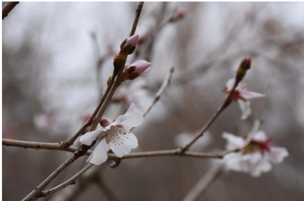
ヤブザクラ 3月16日 3月半ばの開花は初めて