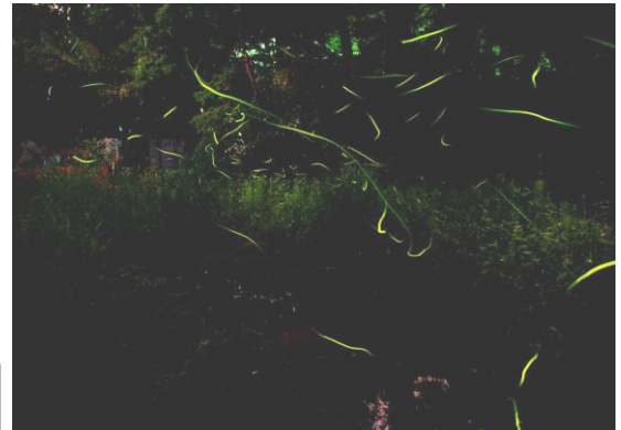
2016.6.17 (トンボ池周辺)