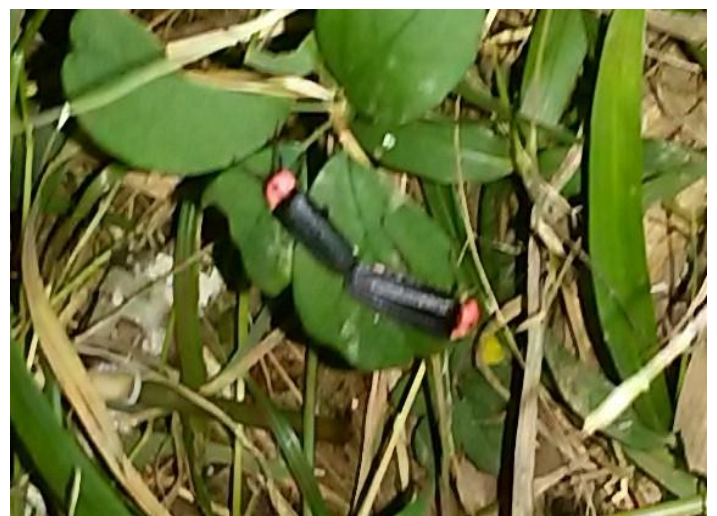
ホタルの生殖活動 (2018. 6. 4)